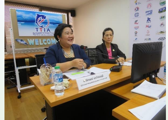
เมื่อวันที่ 10 กันยายน 2562 TTIA จัดอบรมเรื่องหลักการชี้แนะของสหประชาชาติว่าด้วยสิทธิมนุษยชน (UNGPs) และในช่วงบ่าย สมาคมฯ จัดประชุม TTIA HR