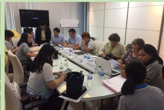
เมื่อวันที่ 11-13 กันยายน 2562 TTIA ติดตามหน่วยงาน Federal Service for Veterinary Phytosanitary Surveillance (FSVPS) ประเทศรัสเซีย เข้าตรวจโรงงานของสมาชิก TTIA