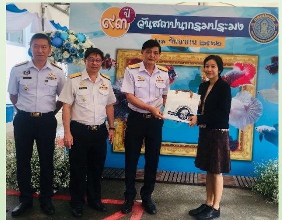
เมื่อวันที่ 20 กันยายน 2562 TTIA ได้เข้าร่วมแสดงความยินดีในวันสถาปนากรมประมงครบรอบ 93 ปี และได้มอบเงินบริจาคสมทบทุนมูลนิธิสมเด็จพระมหิตลาธิเบศรอดุลยเดชวิกรม พระบรมราชชนก