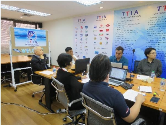
เมื่อวันที่ 9 กันยายน 2562 TTIA จัดประชุมการจัดตั้งสมาคมอาหารสัตว์เลี้ยงไทย (Thai Pet Food Association; TPFA)